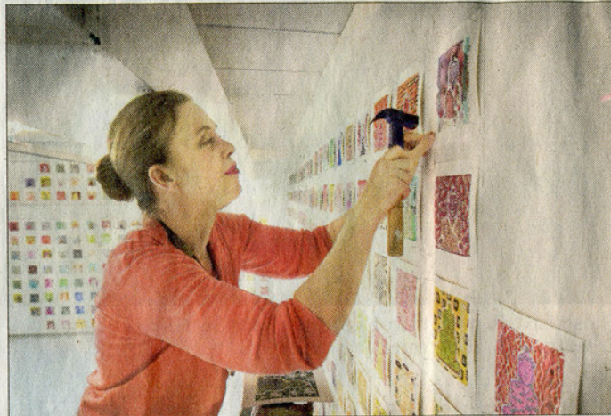
Caroline Pippingin 1000 ja 1 Buddhaa tarjoaa mietiskelyn paikan.

Airaksisen teos sopii nykyajan levottomallekin katsojalle. Ihmisen mittaisten häkkien kuhina muuttuu välillä teräväksi kilinäksi synnyttäen hiljaisuuden musiikkia. Teosta katsoes-